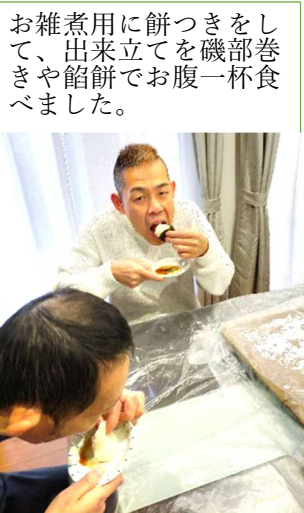
し巻食を一杯つき磯餅を立腹お餅でお出立した。煮出された雑穀、やまおてきま

手作りケーキ クリスマスデザインの後、各人で手作りの大きなケーキがデザートです。