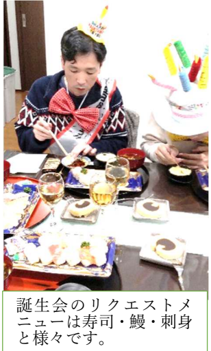
誕生日会のリクエストメニューは寿司・鰻・刺身と様々です。

日々の食事に加え、毎月の誕生日会では該当者のリクエストに応じたメニュー。季節の行事には伝統食の提供と、メリハリや工夫を凝らして手作りしています。