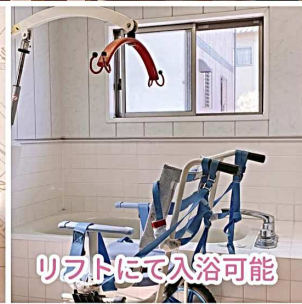
リフトにて入浴可能