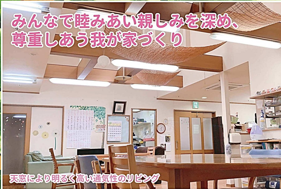
天窓により明るく高い通気性のリビング