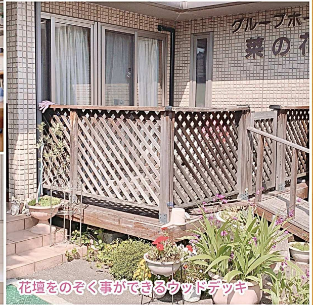
花壇をのぞく事ができるウッドデッキ