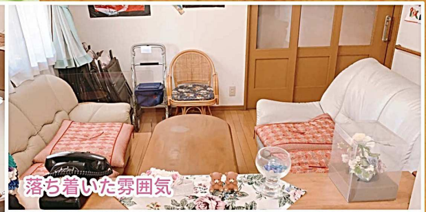
落ち着いた雰囲気