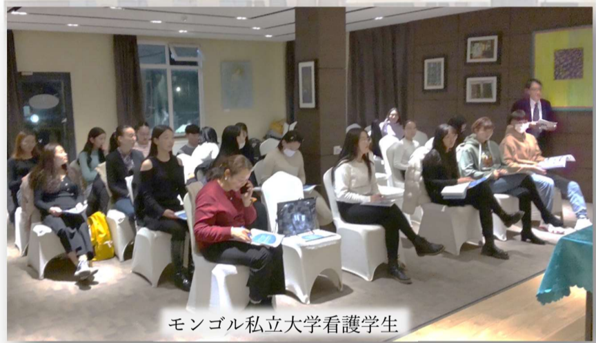
モンゴル私立大学看護学生

日本では69万人介護職員の不足が報じられており、今後介護事業を継続するためには人手不足をどう補充するかという視点が欠かせません。 モンゴルには日本に興味を持ち日本で働いてみたいという医療・看護学生がたくさんいました。