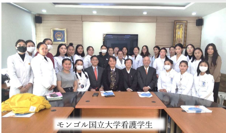
モンゴル国立大学看護学生