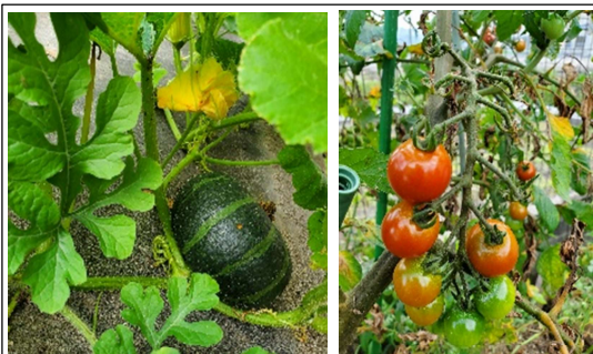
かぼちゃとトマトは売っている物に負けていません 昔懐かしい黄色いスイカも雌雄各出来ました