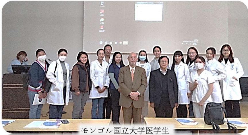
モンゴル国立大学医学生

「2〜3年後の人材を求めて、モンゴル国立・私立大学へ」 このほどモンゴルの医療系国立大学・私立大学へ訪問する機会を得ました。