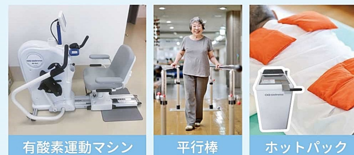
有酸素運動マシン