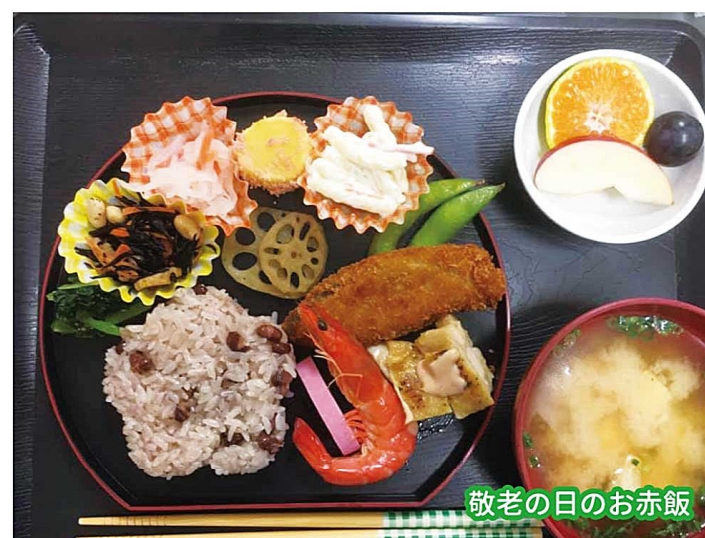
敬老の日のお赤飯