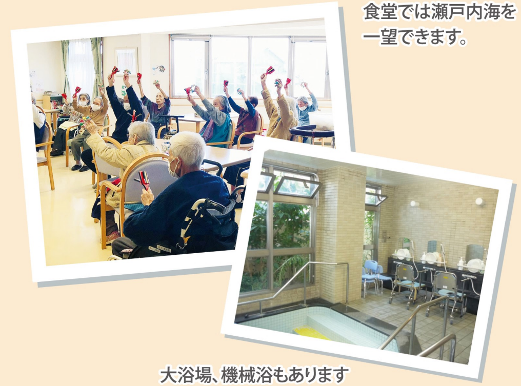
食堂では瀬戸内海を一望できます。

日中は看護師・相談員・介護職員等が常駐しており、各種専門相談を受けることができます。夜間も介護職員が常駐しており、安心して生活を送ることができます。(提携病院:久保内科、北条病院、長谷川歯科) 季節の行事、外出機会、通所介助などそれぞれの人に合わせたメニューをご用意いたします。