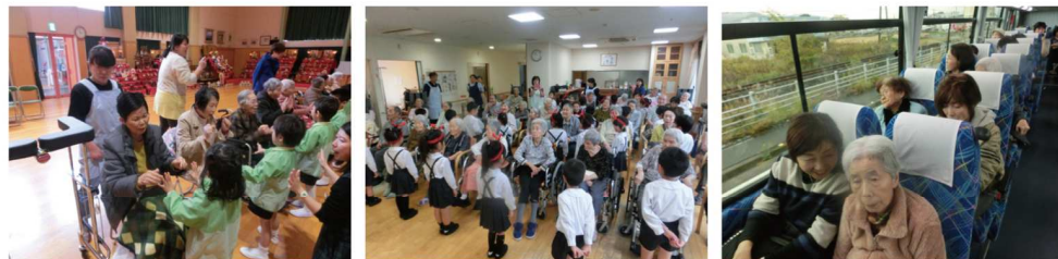
近隣の幼稚園への訪問 (お雛様) つくし幼稚園慰問 (敬老会) 両施設合同 日帰り旅行