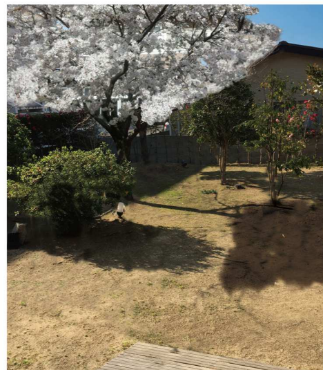
日当たりのよい中庭