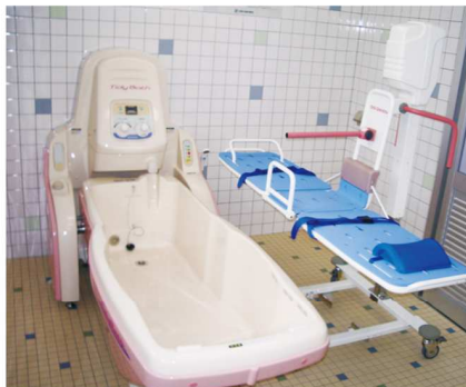
浴室には特浴・リフト浴があります。